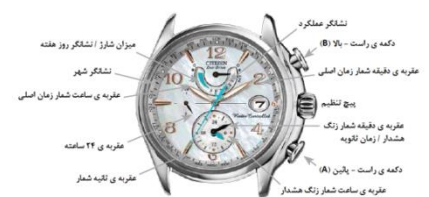
نشانه عملکرد دکمه ی راست - بالا (B) عقربه ی دقیقه شمار زمان اصلی پیچ تنظیم عقربه ی دقیقه شمار زنگ هشدار زمان ثانویه دکمه ی راست - پایین (A) عقربه ی ساعت شمار زنگ هشدار (۲۴ ساعته) از زمان ثانویه

لطفا دستورالعمل تنظیمات تعاملی ما را در آدرس